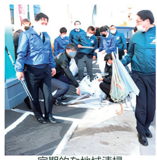
定期的な地域清掃