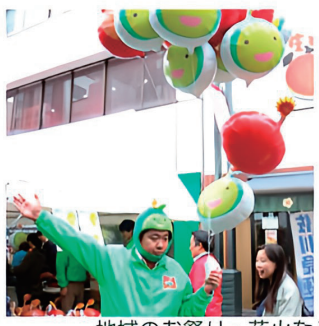
地域のお祭り・花火などイベントへの協賛・寄附