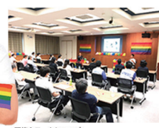
研修&ワークショップ