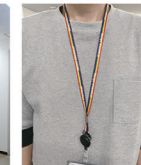
アライストラップ