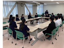
セクシャルマイノリティについての出張授業・講演