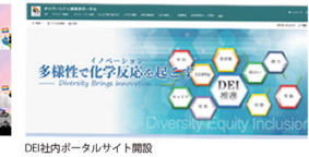
DEIポータルサイト開設