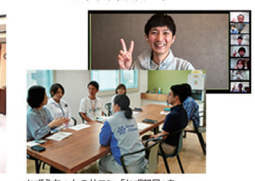
かずえちゃんのサロン「かず部屋」を国内事業所やオンラインで開催