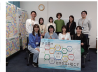
DEIアライネットワーク