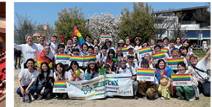
国内事業所のある各地域でのパレードに参加