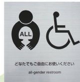
だれでもトイレを複数事業所に設置