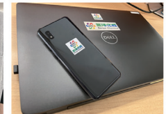
アライステッカー