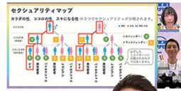
部内作成ミニ講座「マナビバ」SOGIやLGBTQについて配信