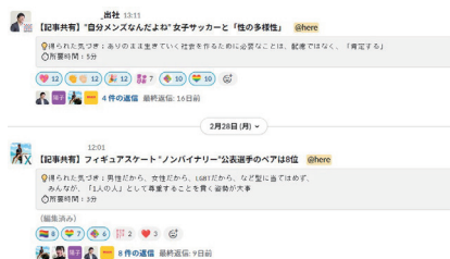
SEPALLY Friends向け情報共有チャンネル