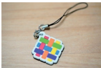
SEPALLY Friendsに配布するキーホルダー