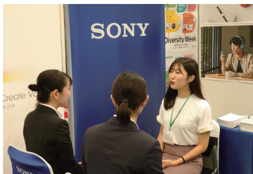
学生向け社外イベント (※2019年に撮影されたものです)