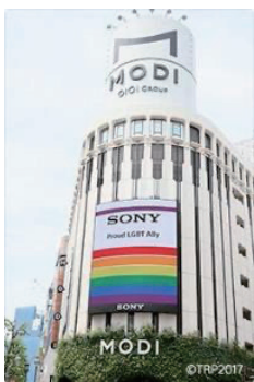
TRP協賛メッセージ “Proud LGBT Ally”

これまでに、社外の企業や団体を巻き込んだイベントを実施、2019年には遠方の学生など会場に来れない方にもイベントをオンラインで配信、2020年には社内イベントをオンライン化、グループ会社の社員も気軽に参加できるようにするなど、社内外の垣根や場所の制約をなくし、広く理解を促進