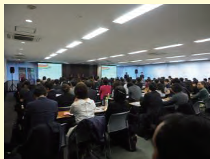
実際のセミナーの様子

観光のLGBT施策スペシャリストによるLGBTセミナーです。第一部をLGBT基礎知識、第二部をLGBTツーリズム・マーケティングとする二部構成のセミナー(2時間目安)を実施し、優良顧客であるLGBTに関する理解を深め、旅行客のニーズの把握やPR方法などマーケティングの詳細、適切な接遇の仕方などを、きめ細かく学んでいただけます。