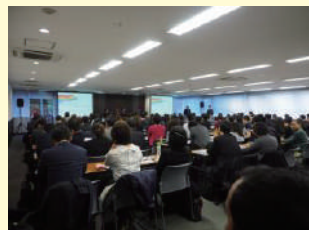
実際のセミナーの様子

観光のLGBT施策スペシャリストによるLGBTセミナーです。第一部をLGBT基礎知識、第二部をLGBTツーリズム・マーケティングとする二部構成のセミナー(2時間目安)を実施し、優良顧客であるLGBTに関する理解を深め、旅行客のニーズの把握やPR方法などマーケティングの詳細、適切な接遇の仕方などを、きめ細かく学んでいただけます。